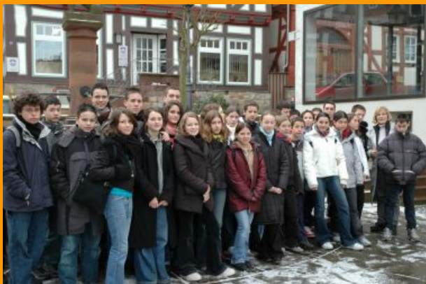
échange de jeunes en 2005

Ses membres bénévoles organisent depuis cette date des échanges et des voyages vers l'Allemagne.