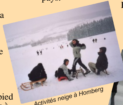
Activités neige à Homberg